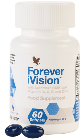
Art. 624 Forever iVision™