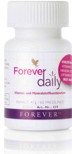
Art. 439 Forever daily™