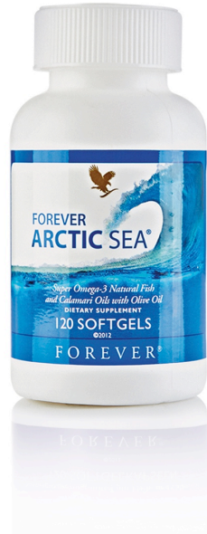
Art. 376 Arctic Sea®