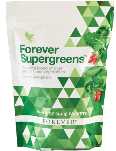
Art. 621 Forever Supergreens™