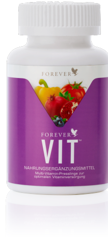
Art. 354 Forever VIT™