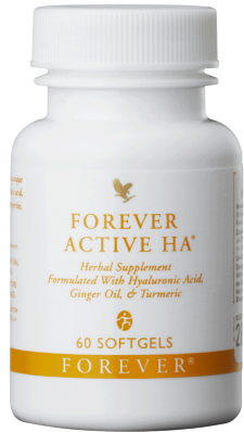
Art. 264 Active HA®